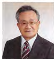
糖尿病内分泌センター長

患者会も活発で親睦旅行、勉強会（月に1回）を開催しています。医療者も負けずに学会で発表し常に最新の医療技術の更新に努めています。CGM、CSIIや